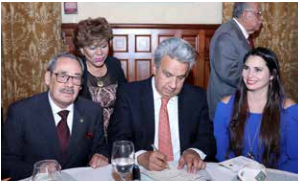
Participación de la Casa de la Cultura en los proyectos 'Museo del Pasillo' y 'Arte en el Barrio'

Para el 'Museo del Pasillo, la CCE prestó por el lapso de cinco años, ocho instrumentos musicales del Museo Pedro Pablo Traversari, para que sean expuestos en este lugar, entre estos, una trompeta (s. XIX), un clarinete (s. XX), una tromba y un trombón (s. XX), una flauta, un oboe, un piccolo y una tuba (s. XX).