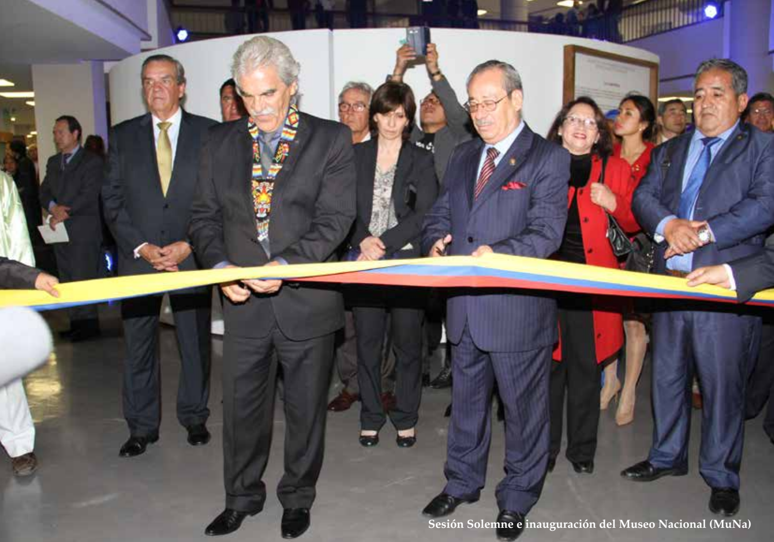
Sesión Solemne e inauguración del Museo Nacional (MuNa)