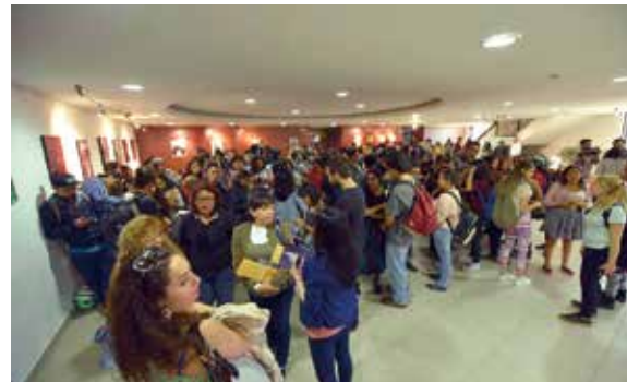
Vestíbulo de la Sala de Cine en la FLACQ