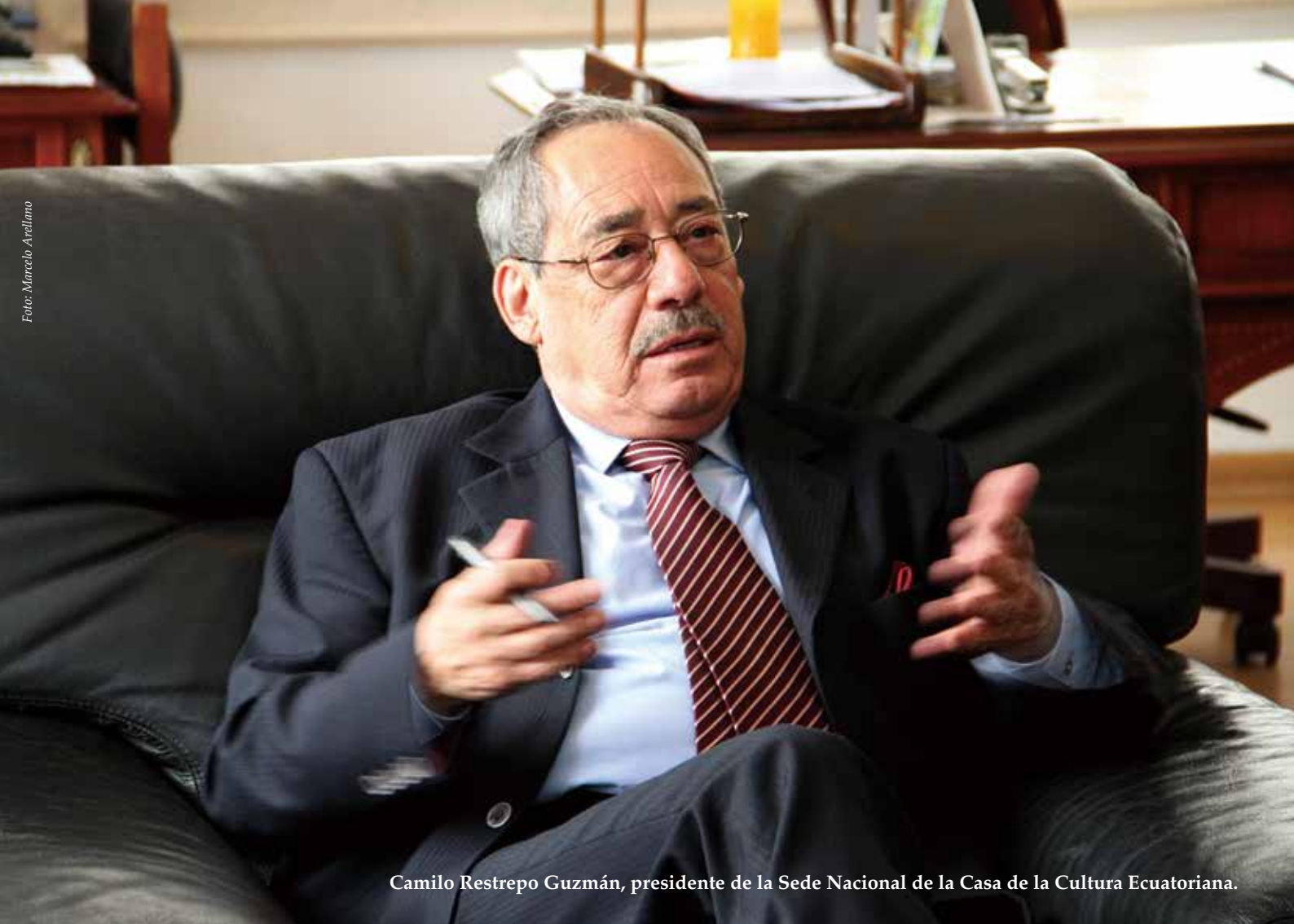
Camilo Restrepo Guzmán, presidente de la Sede Nacional de la Casa de la Cultura Ecuatoriana.