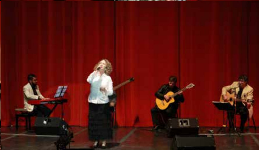
Artistas en la Sesión Solemne del Día de la Cultura y los 74 años de la CCE