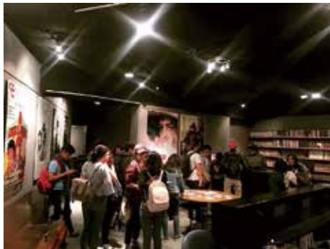
Consulta Pública de la Cinemateca Nacional