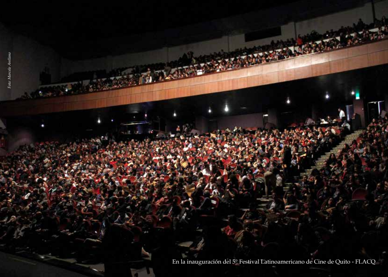
En la inauguración del 5º Festival Latinoamericano de Cine de Quito - FLACQ