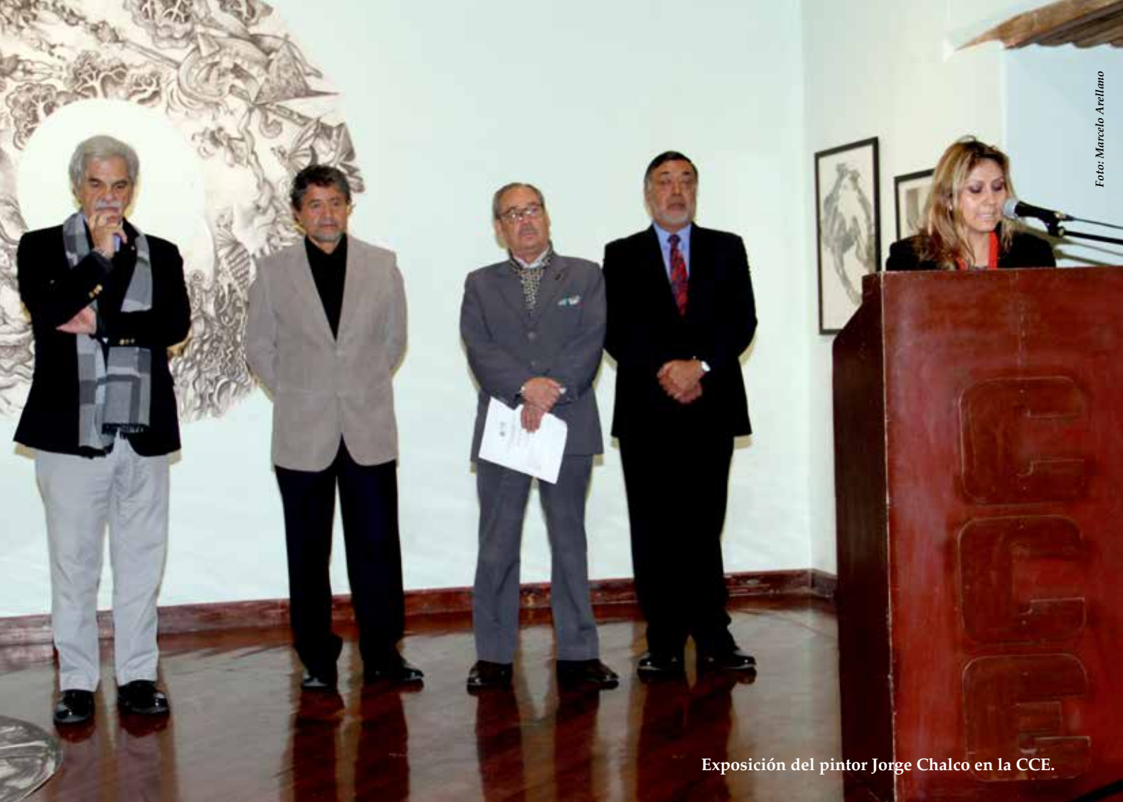
Exposición del pintor Jorge Chalco en la CCE.