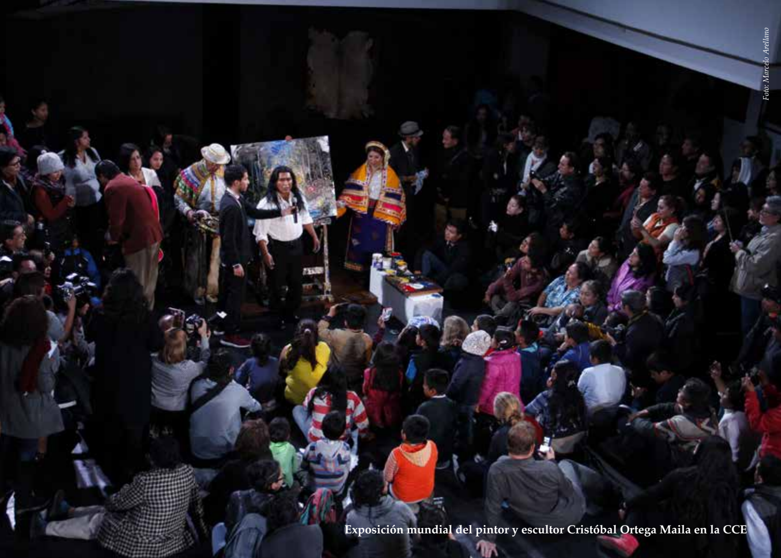
Exposición mundial del pintor y escultor Cristóbal Ortega Maila en la CCE