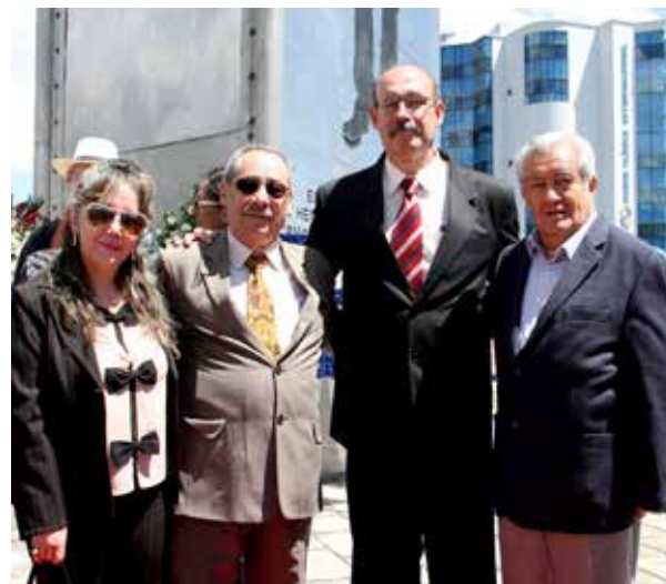
Commemoración del natalicio de José Martí y la muerte de Eloy Alfaro