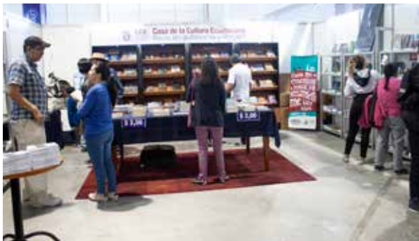
La Librería de la CCE presente en la FIL