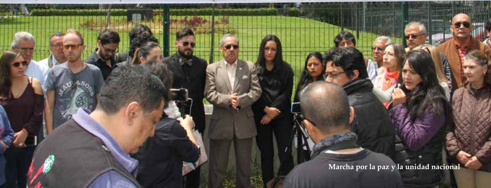
Marcha por la paz y la unidad nacional