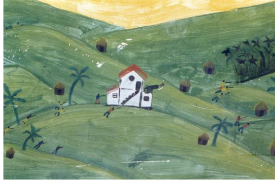
Mural cívico existente en Bilován, en la Pared de la escuela "Josefina Barba"